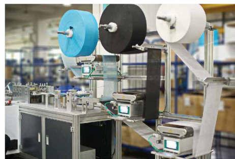
光學自動補償送料裝置